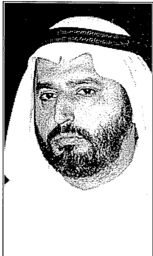
د. عادل الصبيح