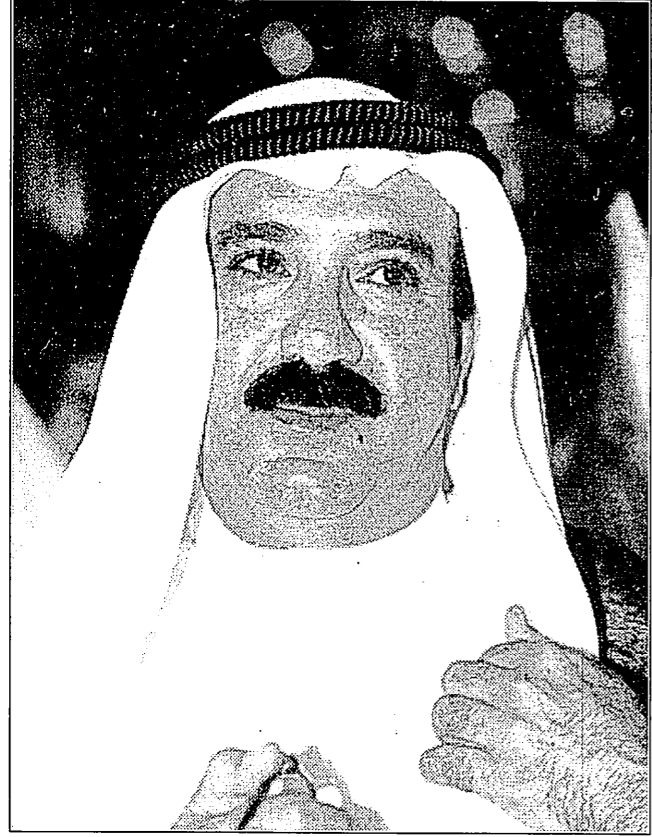
الشيخ ناصر صباح الأحمد الصباح