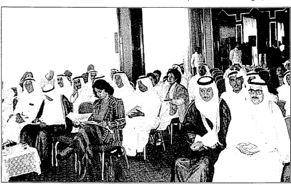
جانب من حضور الندوة