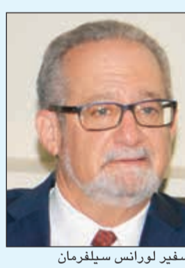
السفير لورانس سيلفرمان

وبالتالي تحرص الولايات المتحدة على التفاوض معها بشأن مختلف القضايا، وخصوصاً ما يتعلق بإيران والعراق، وكذلك الأزمة الخليجية التي يجب أن تنتهي للحفاظ على كيان ووحدة مجلس التعاون ليكون قادراً على مواجهة التحديات الإقليمية، مشدداً على أن بلاده كانت وما زالت ملتزمة بأمن وأمان الكويت. هذا، وقد غادر نائب رئيس مجلس الوزراء ووزير الخارجية الشيخ صباح الخالد البلاد أمس متوجهاً إلى واشنطن للانضمام إلى الوفد الرسمي المرافق لصاحب السمو.