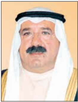
الشيخ ناصر صباح الأحمد