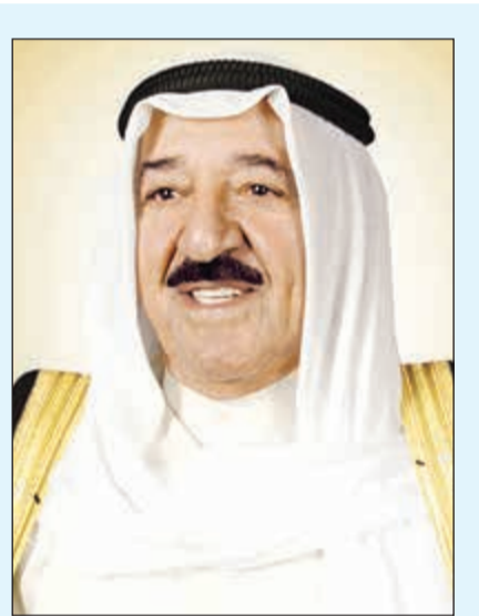
صاحب السمو الأمير الشيخ صباح الأحمد